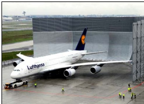
Standlauf- einrichtung Flughafen Frankfurt (M.)

Wir suchen zur Verstärkung unseres Teams eine/n studentische/n Mitarbeiter/in mit guten Kenntnissen in der technischen Akustik.