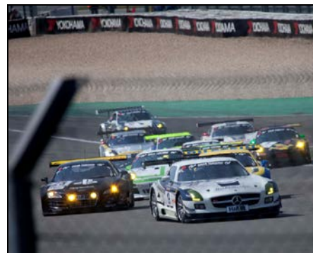
Ermittlung von Motorsport- geräuschen

Sie würden bei uns in verschiedenen Projekten mitarbeiten und dabei die Arbeit in einem Beratungsbüro sowie aktuelle Messtechnik und Prognosesoftware kennenlernen.